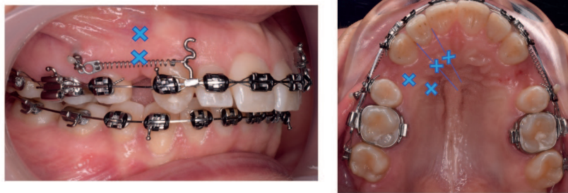
Rycina 1. Znakiem "X" zaznaczone są miejsca wykonywania nawięrtów, 2 przedsionkowo i 2 podniebiennie dystalnie w stosunku do kła oraz podniebiennie: pomiędzy kłem i bocznym zębem siecznym oraz pomiędzy siekaczami danej strony.

Figure 1. The "X" marks the places of drilling, 2 vestibulary and 2 palatally distal to the canine and palatally: between the canine and the lateral incisor and between the incisors.