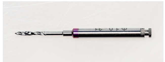
Rycina 2. Wiertło pilotujące do mini-implantów firmy AbsoAnchor® (Dentos, Daegu, South Korea) o średnicy 1 mm.

W zależności od normalności rozkładu lub jej braku, do porównania takiej zmiennej jak wielkość luki poekstrakcyjnej w grupie badanej (A) i kontrolnej (B) użyto testu t-Studenta lub Wilcozona. Wykorzystano podstawowe statystyki opisowe, takie jak średnia arytmetyczna (średnia), minimum (Min.), maximum (Max.), mediana, pierwszy kwartył (1st Qu.) i trzeci kwartył (3rd Qu.) W celu porównania szybkości zamykania luki po ekstrakcji górnych pierwszych zębów przedtrzonowych w kolejnych okresach obserwacji w obu